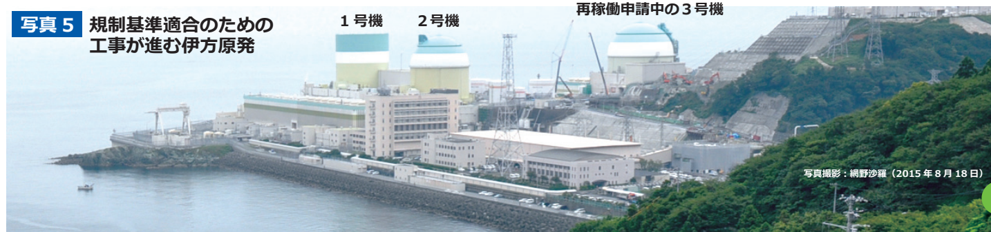
写真 5 規制基準適合のための工事が進む伊方原発