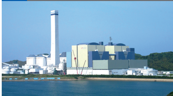
写真3 徳島県にある電源開発の橋湾火力発電所

日本最大の卸売り電気事業者である電源開発（Jパワー）は、徳島県阿南市に橋湾発電所210万kWの火力発電設備をもっています。210万kWは202万kWの伊方原発を上回る発電設備です。もっとも210万kWの発電設備は、半分以上電力需要の旺盛な関西電力向けです。電源開発橋湾発電所に隣接して四国電力も橋湾発電所70万kWをもっていて、この2カ所の発電設備で280万kWの容量です。もともと電力需要の小さい四国を市場とする四国電力は、関西電力に販売する事を電気事業の柱としてきました。電源開発は卸売り電気事業者ですから全量電力会社に販売します。そのほか電源開発は高知県に早明浦水力発電所など4カ所の水力発電設備合計18.7万