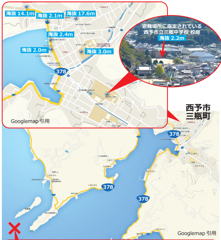
図1 伊方原発 30km 圏内、愛媛の水源のひとつ 愛媛県西予市三瓶町

いったん伊方原発で放射能災害が起これば、被曝を覚悟しなければならぬ、ということです。そうまでして伊方原発を再稼働させるには、よほどの経済合理性、社会的必要性がなければなりません。実際には伊方原発を再稼働させる経済合理性も社会的必要性も全くないのです。