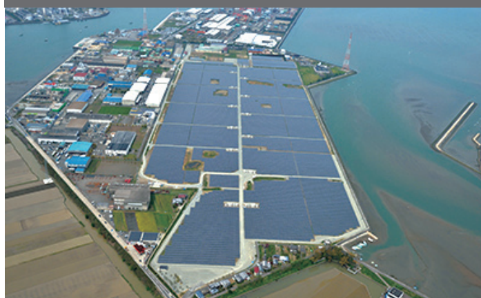
写真4 愛媛県に今年6月に完成した「西条小松太陽光発電所」

【参照資料】今治造船株式会社 web サイトより「西条小松太陽光発電所完成 四国最大規模 33MW」 http://www.imazo.co.jp/html/comp/news/150625.html